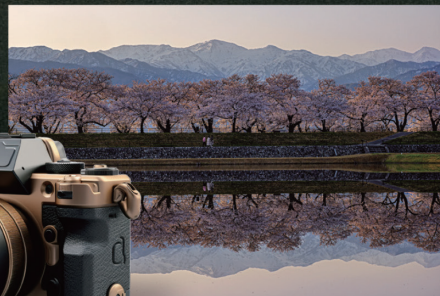
JAPAN TRAILフォトコンテスト2024 受賞作品