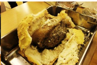
↓ 第 2 回の様子