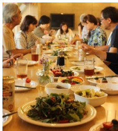
↑ 第 1 回の様子